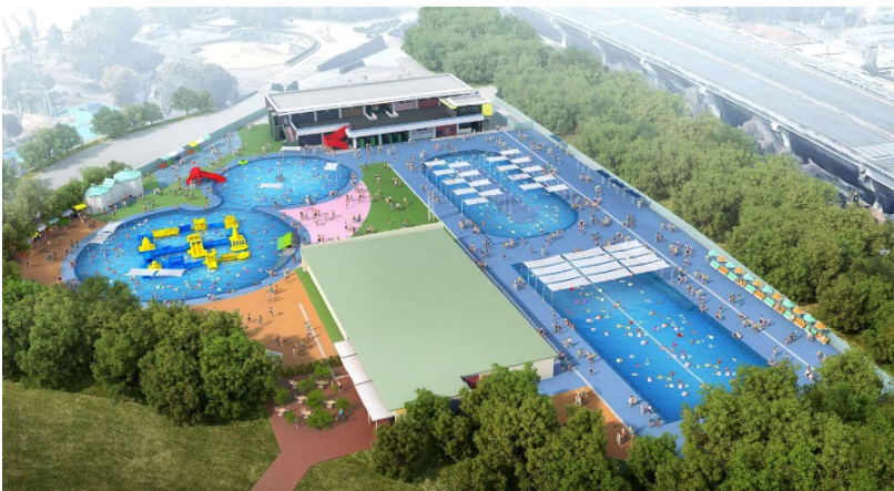
【リニューアルプールイメージ】

業務内容：新久宝寺緑地プールの設計・建設、公園全体の管理運営（指定管理業務）、魅力向上事業